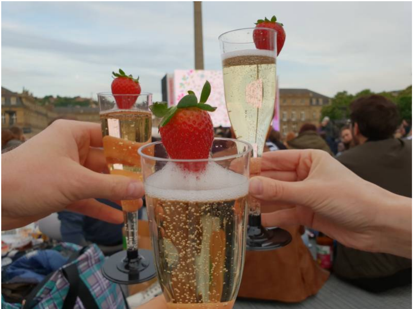
Die Statue hat wohl härter gefeiert, als ich den ganzen Monat