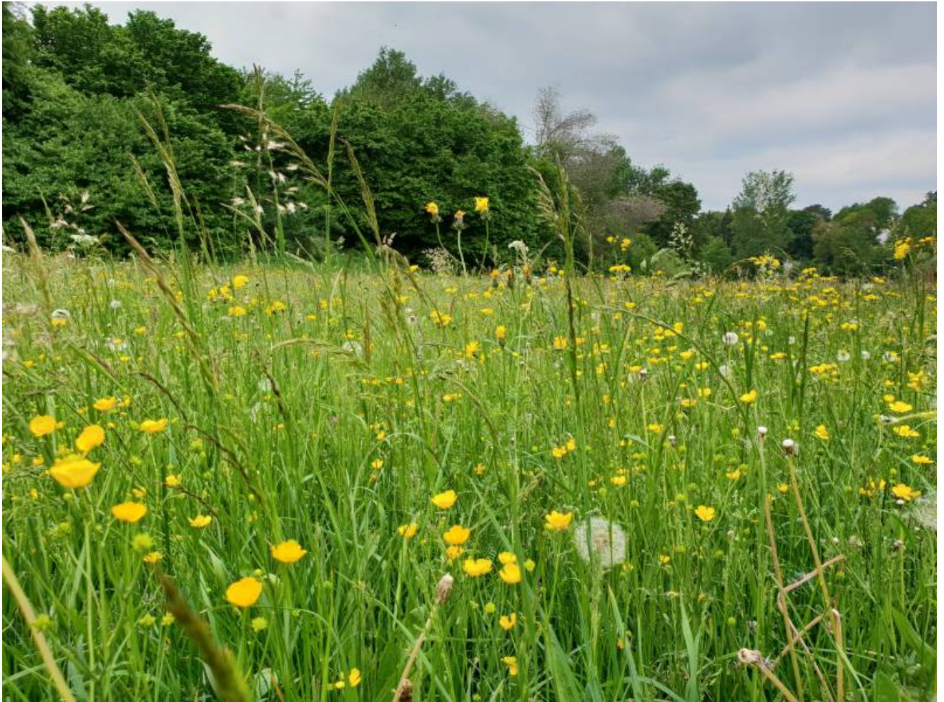
Spinnennetz an einer Brücke