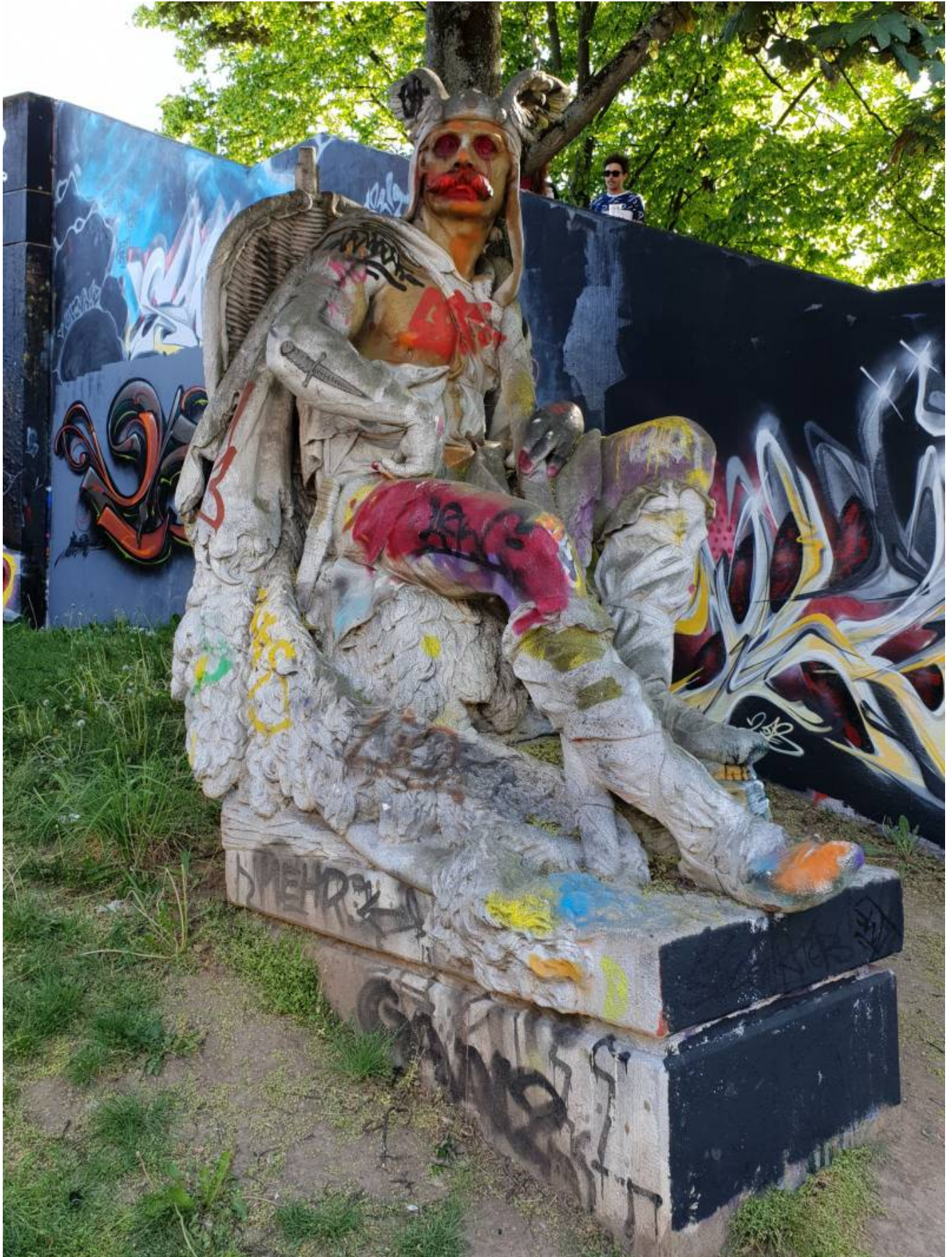
„God ray“ aus dem Zug heraus