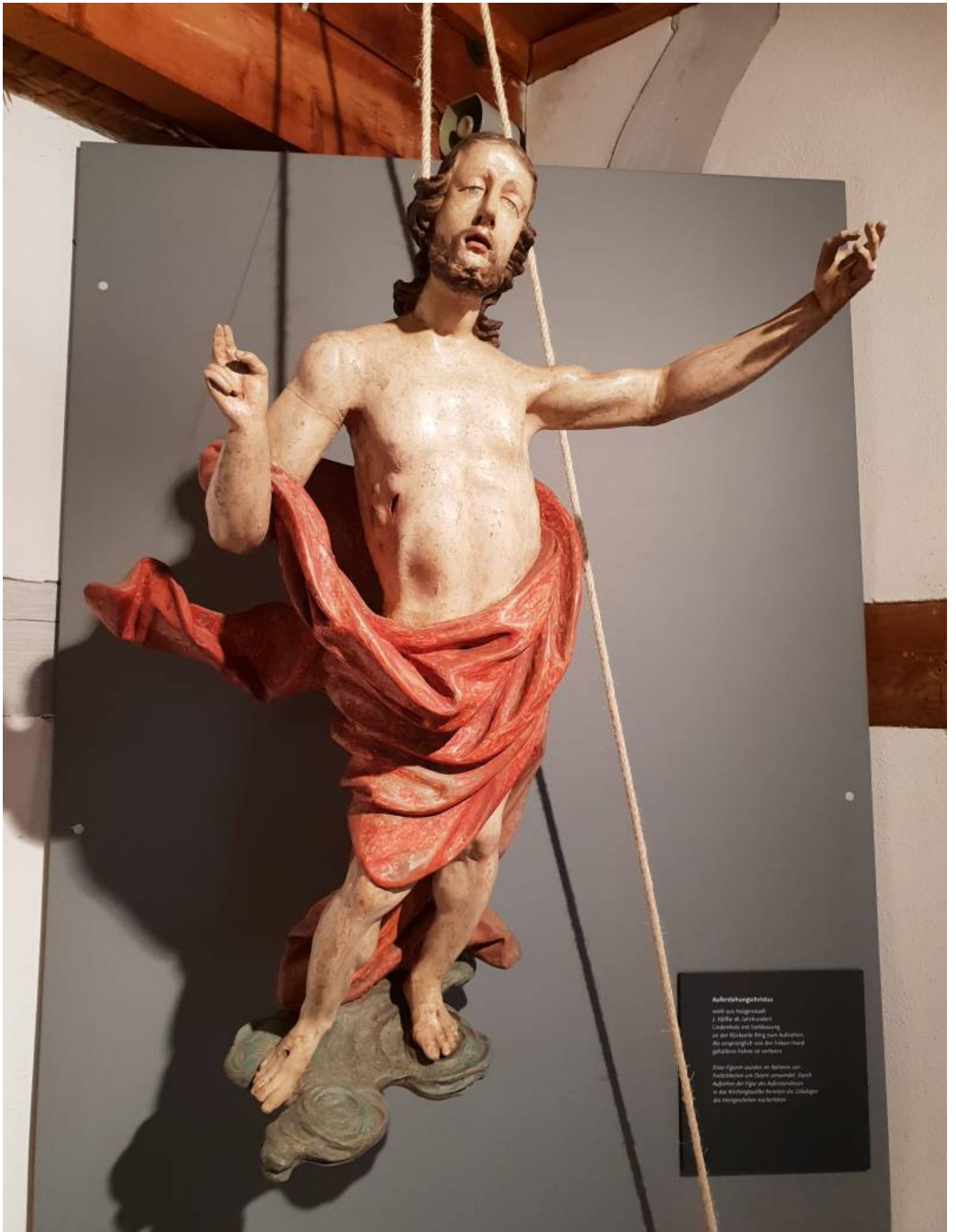
Ascension of Christ The figure of Christ is shown rising from a stone base, suspended by ropes. He is wearing a red robe and has a crown of thorns on his head. The sculpture is displayed against a grey background.